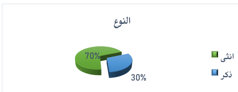
الشكل (1) توزيع أفراد العينة حسب النوع

كما أوضحنا سابقاً أن الاستبانة أرسلت إلكترونياً إلى جميع أفراد مجتمع الدراسة البالغ عددهم 155 موظف وموظفة، استرجع منها 33 استبانة مكتملة وصالحة للتحليل وهي تشكل نسبة 20% من حجم مجتمع الدراسة، ويعود سبب انخفاض استجابة عينة الدراسة إلى الوضع الذي تمر به السلطنة من جراء انتشار حالات الإصابة بكورونا، مما أدى إلى إحالة معظم الموظفين للعمل من المنزل وهو ما أثر سلباً على عدد الاستجابة، ومع ذلك تعتبر نسبة الاستجابة جيدة بحكم انسجام مجتمع الدراسة من ناحية التأهيل والمهام الوظيفية. واتضح من نتائج التحليل سمات مجتمع الدراسة وفق النوع، ومجال التخصص، والمستوى التعليمي، كما يتضح من الشكلين (1) و (2).