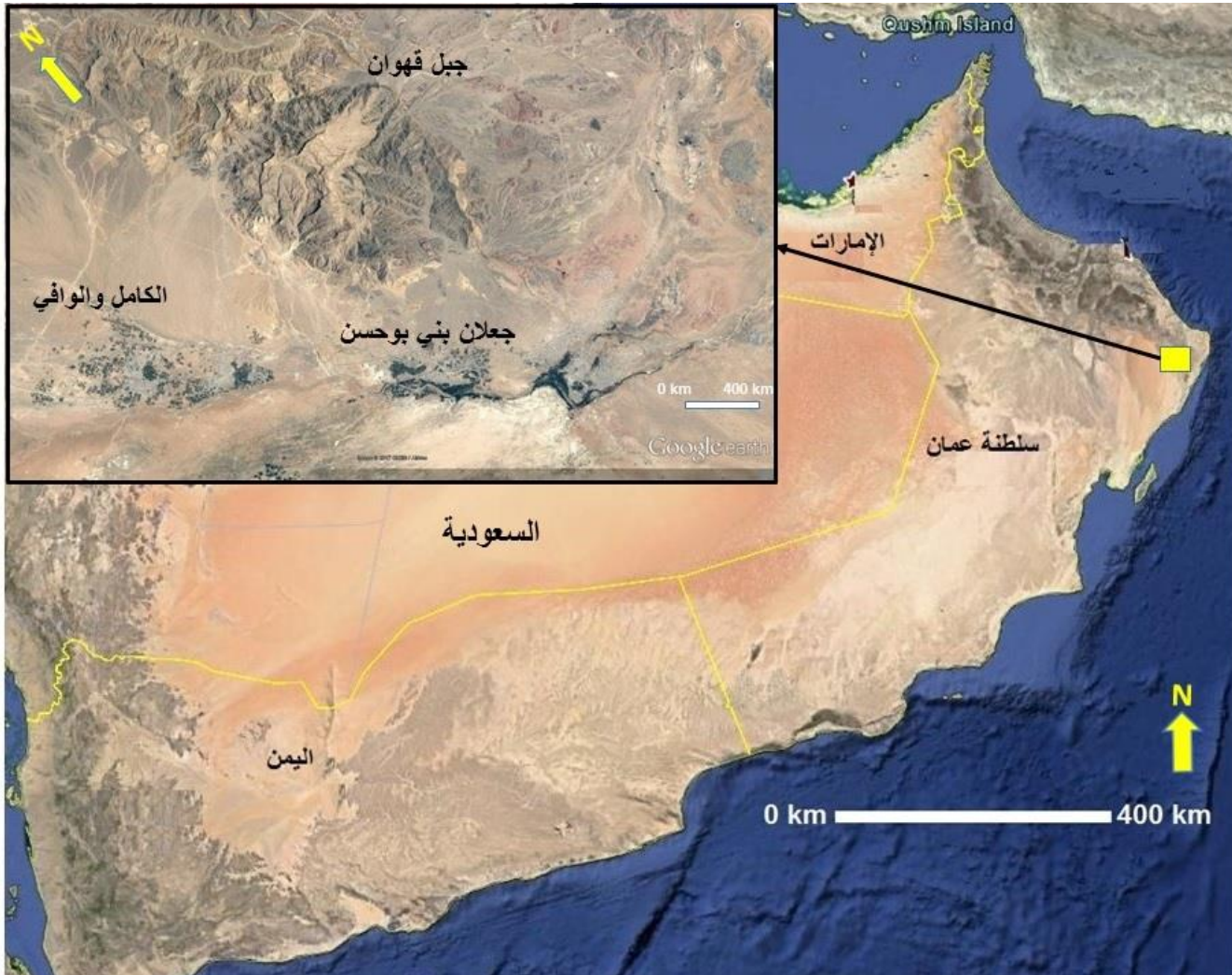
شكل (١) منطقة الدراسة في الجزء الغربي من إقليم جعلان

يهدف هذا البحث إلى توثيق نقش حجري نادر تم العثور عليه أثناء المسح الذي أجراه الباحث عام ٢٠١١م في منطقة جعلان بني بوحسن في محافظة جنوب الشرقية بسلطنة عمان (الشكل ١)، وقد أطلق عليه اسم "نقش جعلان". وهذا النوع من النقوش نادر في شمال عمان، ويكثر وجوده في جنوبها، وتحديداً محافظة ظفار، وكذلك اليمن، فقد تمت الإشارة إليها من قبل الهواة والرحالة منذ بدايات القرن العشرين؛ ففي محافظة ظفار، كما سنرى في هذا البحث، تم العثور عليها في مناطق جغرافية مختلفة، ما بين مناطق الجبال، والسهول، والصحراء، وكانت منفذة إما بأسلوب النقر في الصخر أو أنها مطبوعة بالأوان داكنة، كما هو الحال في كثيرٍ من النقوش التي وجدت في كهوف هذا الإقليم الجنوبي، فلقد عثر على الكثير من هذه النقوش بالقرب من القبور والأحجار الثلاثية في محافظة ظفار (cf. al-Shahri & King 1992)، وينطبق هذا الأمر على الحجر موضوع الدراسة في هذا البحث، فقد عثر عليه بالقرب من أحد القبور القريبة من الأحجار الثلاثية في منطقة سيح السعد، هذا ولم يعثر أي من الرحالة أو الباحثين على مثل هذا النوع من النقوش في شمال عمان ووسطها؛ فقد قامت البعثة البريطانية بقيادة بياتريش دي كاري (de Cardiet al. 1977; Doe)