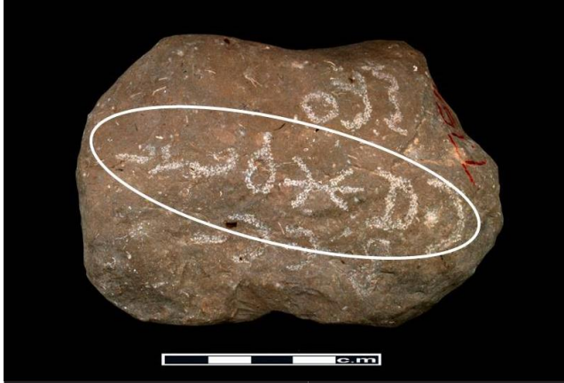
شكل (٦) السطر الثاني الواسطي ٥ أو ٦ أشكال