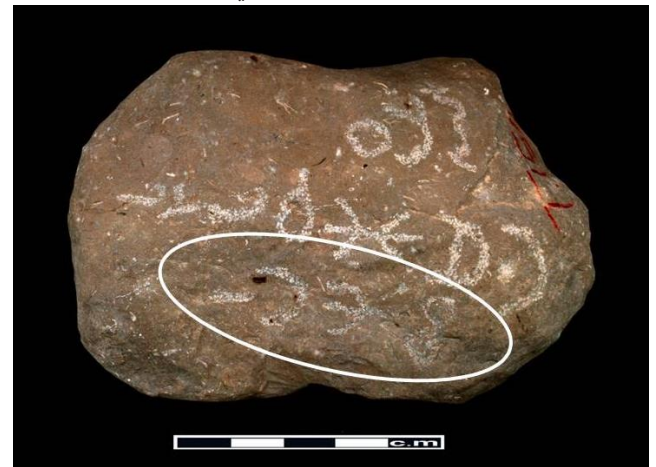
شكل (٧) السطر الثالث السفلي ٤ أشكال

حاول هذا البحث توثيق واحد من النقوش الحجرية التي يندر العثور عليها خارج إقليم ظفار بسلطنة عمان، ويعد هذا النقش هو أول نقش حجري يتم العثور عليه في المنطقة الشرقية من عمان، وتشير الأدبيات إلى تكرار وجود هذا النوع من النقوش غير الرسمية في مناطق مختلفة من محافظة ظفار، ويمتد انتشارها خارج هذا الإقليم باتجاه جنوب اليمن، وقد تم في هذا البحث مقارنة نقش جعلان بنقوش أخرى مشابهة من ظفار، ومن ثم مقارنته بأشكال وأحرف وردت في نقوش تعود إلى كتابات سامية جنوبية قديمة من أجل التعرف على مضمون النقش، وتبين بأن الأشكال المتكررة في نقش جعلان لها ما يشبهها في بعض كتابات جنوب الجزيرة العربية مثل اللحيانية، والتمودية، والصفوية،